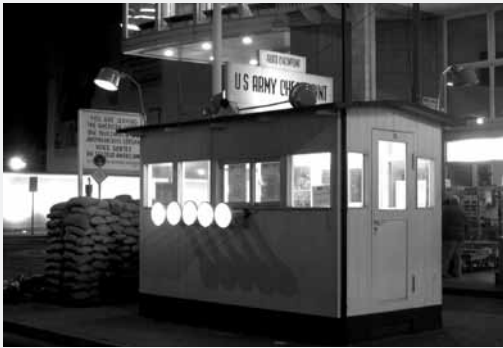
El checkpoint Charlie.

A poco más de diez años de la caída del Muro de Berlín, en la ciudad ya quedaban muy pocos vestigios de lo que fue el ícono de la Guerra Fría.