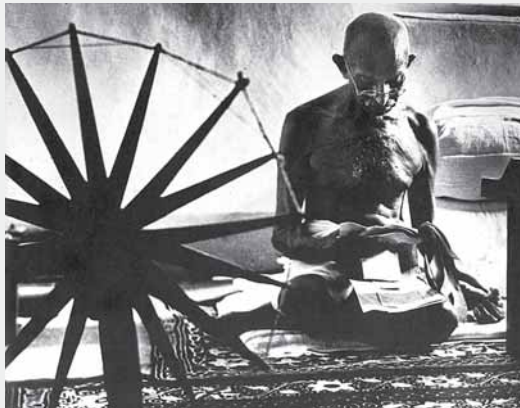
Ghandi leyendo en su casa, 1946.

Las imágenes hablan de lo que muestran pero también (y mucho más) de la época y las intenciones con las que fueron hechas y puestas a circular. Esta fotografía es una buena oportunidad para conocer más de Gandhi pero también, del fotoperiodismo.