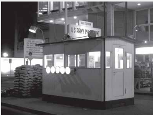
El checkpoint Charlie.

A poco más de diez años de la caída del Muro de Berlín, en la ciudad ya quedaban muy pocos vestigios de lo que fue el ícono de la Guerra Fría.